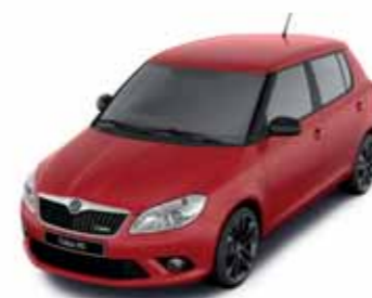
Červená Corrida uni