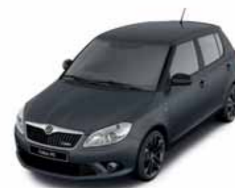
Šedá Anthracite metalíza