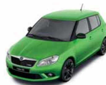
Zelená Rallye metalíza