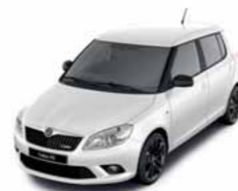
Bílá Candy uni