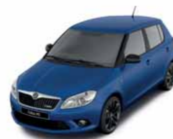
Modrá Race metalíza