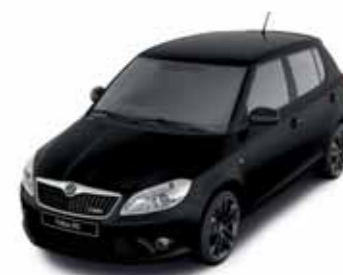
Černá Magic s perletovým efektem

Navrhňte si svůj vůz v barevném provedení, které zdůrazní Vaši individualitu. Vyberte si pro sebe tu nejlepší kombinaci vnějšího laku, barevné střechy a kol z lehké slitiny tak, aby Vaše Fabia RS odrážela Váš styl. Nabízené kombinace vnějších laků a barevných střech najdete v příložené tabulce. A jaká zvolíte kola, záleží jen na Vás.