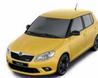
Žlutá Sprint special