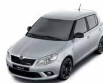
Stříbrná Brilliant metalíza